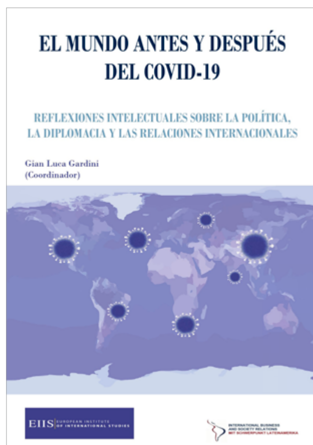
Portada del libro El mundo antes y después del COVID-19. Reflexiones intelectuales sobre la política, la diplomacia y las relaciones internacionales .

concertación mundial de nuestros días. Hay una revisión crítica de las condiciones que provocaron una reacción poco eficaz y lenta ante la covid-19, en la que la crisis de credibilidad que afrontan el multilateralismo y la democracia como motores del desarrollo y progreso son comunes denominadores. A su vez, la aparición cada vez mayor de regímenes con carácter populista y nacionalista son otro síntoma que explica la falta de rumbo coordinado como respuesta a la emergencia desatada por la pandemia.