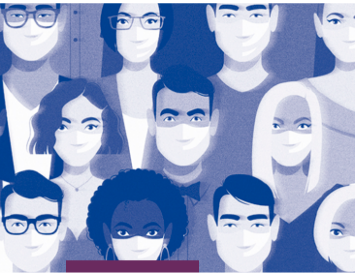
Ilustración (modificada) @melazerg.

Figuras: Revista académica de investigación , vol. 2, núm. 2, marzo-junio 2021.