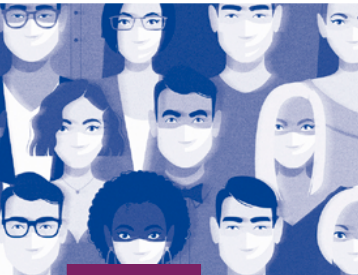
Ilustración (modificada) @melazerg.

FIGURAS REVISTA ACADÉMICA DE INVESTIGACIÓN