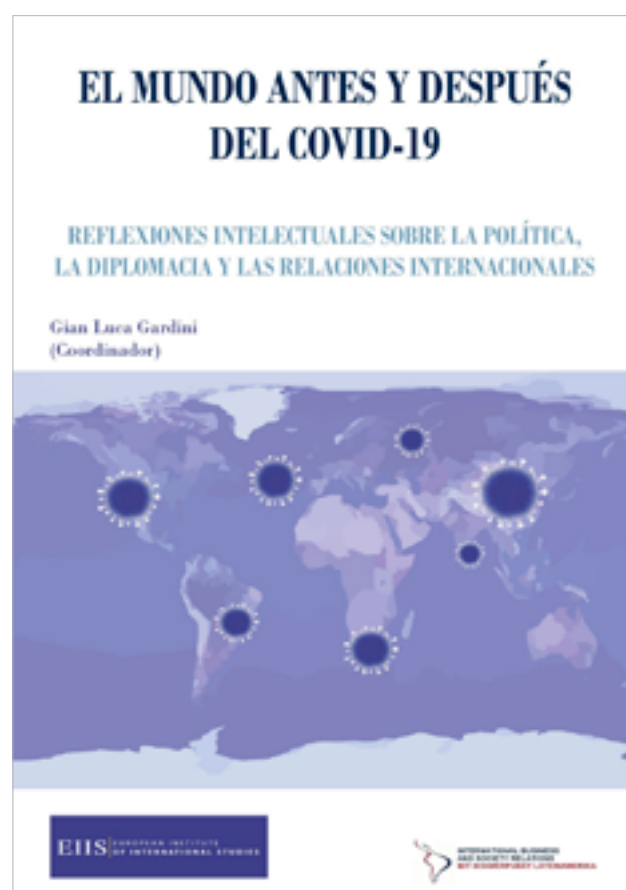
Portada del libro El mundo antes y después del COVID-19. Reflexiones intelectuales sobre la política, la diplomacia y las relaciones internacionales .

concertación mundial de nuestros días. Hay una revisión crítica de las condiciones que provocaron una reacción poco eficaz y lenta ante la covid-19, en la que la crisis de credibilidad que afrontan el multilateralismo y la democracia como motores del desarrollo y progreso son comunes denominadores. A su vez, la aparición cada vez mayor de regímenes con carácter populista y nacionalista son otro síntoma que explica la falta de rumbo coordinado como respuesta a la emergencia desatada por la pandemia.