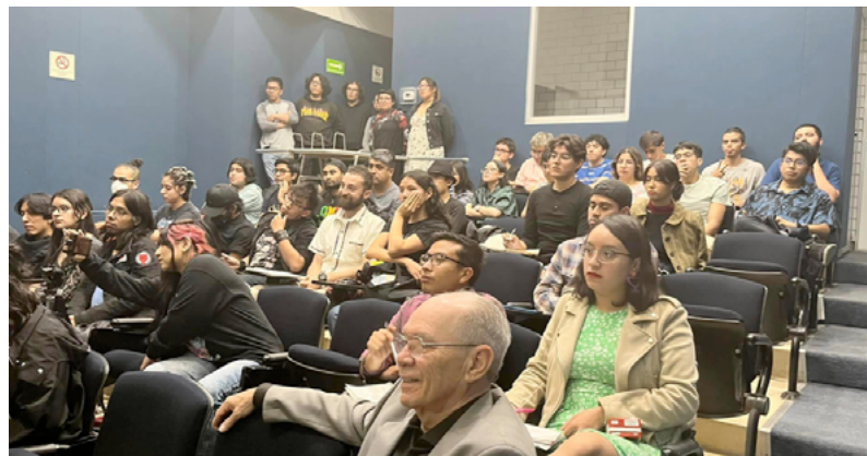
Asistentes al coloquio “Nociones y prácticas de la justicia en la Historia y Filosofía mexicanas”.