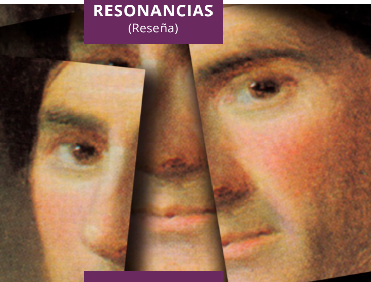
Detalle de la cubierta del libro Las confesiones de Jean-Jacques Rousseau . Madrid: Alianza editorial, 2008.

FIGURAS REVISTA ACADÉMICA DE INVESTIGACIÓN